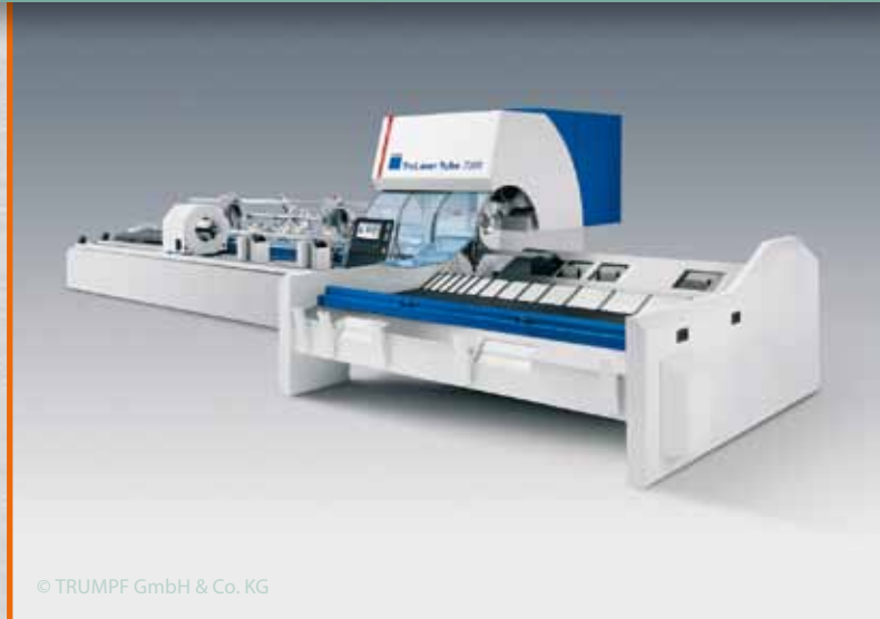
© TRUMPF GmbH & Co. KG