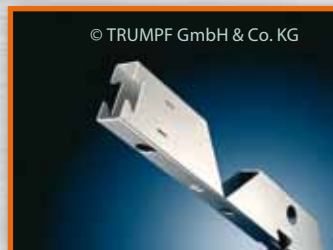
© TRUMPF GmbH & Co. KG